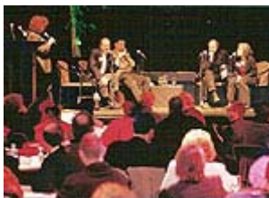
Forum des Journées, 2000.