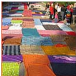
Mireille Racine, Québec